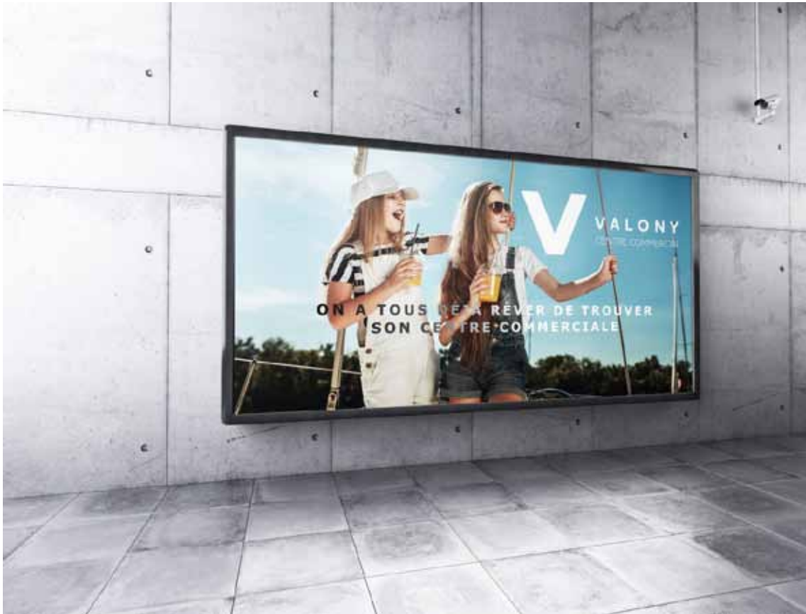
Réalisations d'un mockup d'un panneau publicitaire.