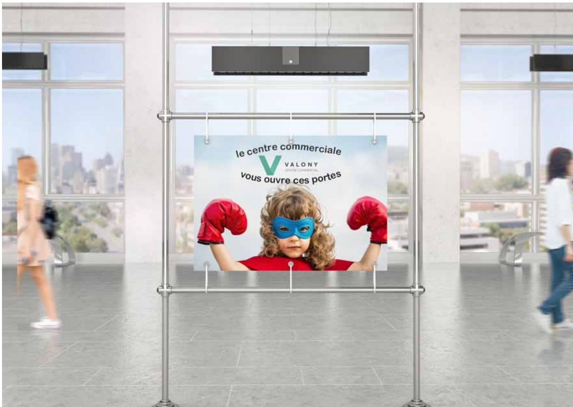
Réalisations d'un mockup d'un panneau publicitaire dans une gare.