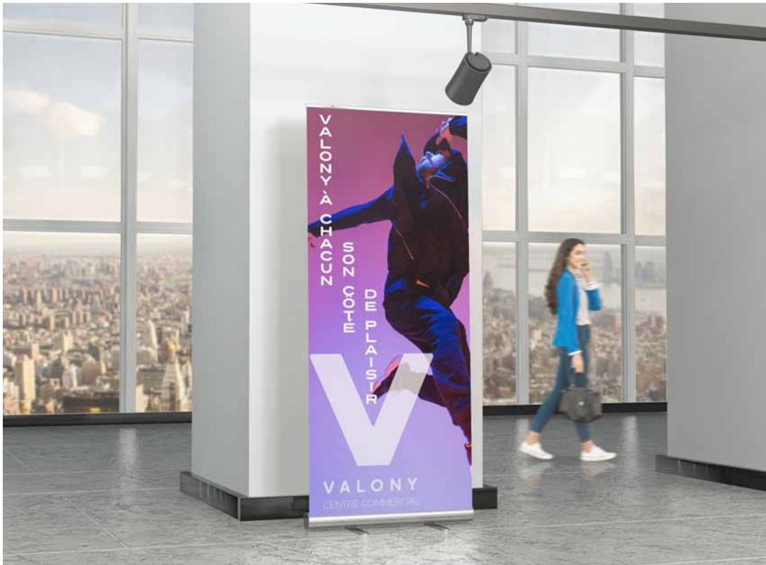
Réalisations d'un mockup d'une bannière publicitaire.