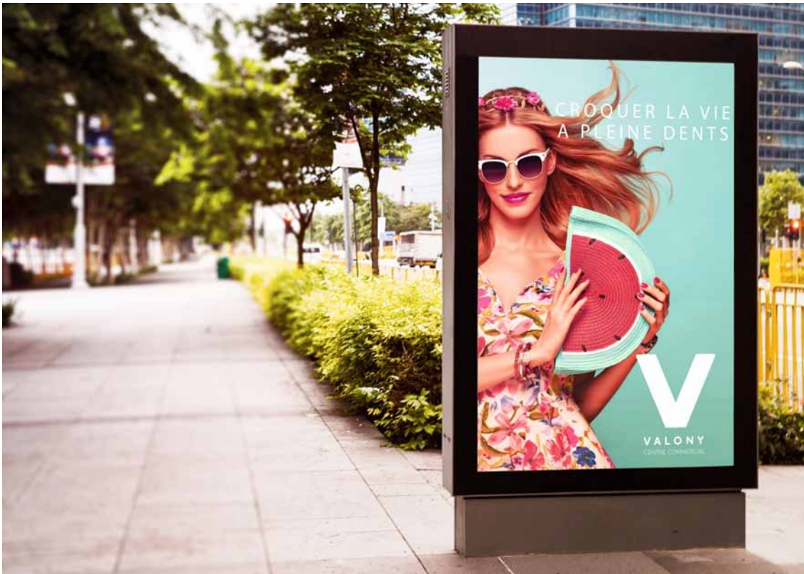
Réalisations d'un mockup d'un panneau publicitaire sur un lieu public.