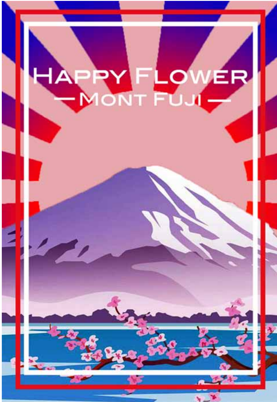
Réalisations d'une affiche pour une soirée.