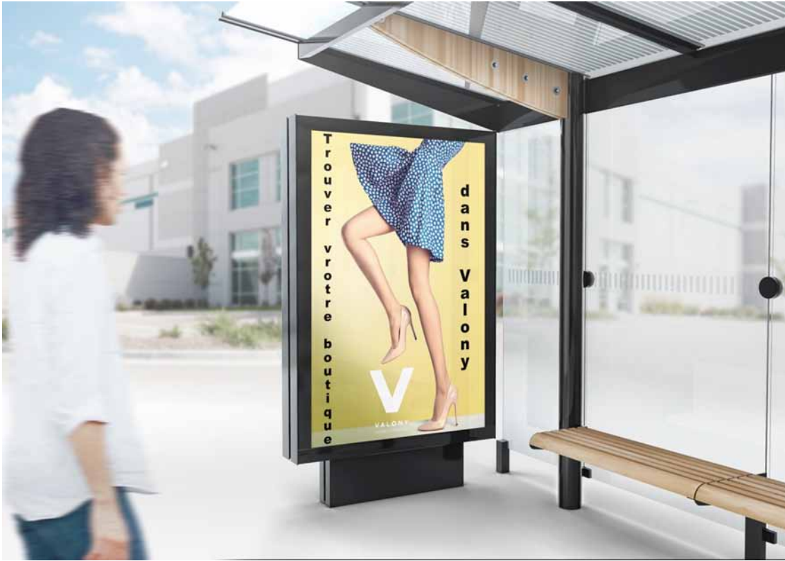
Réalisations d'un mockup d'un arrêt de bus.